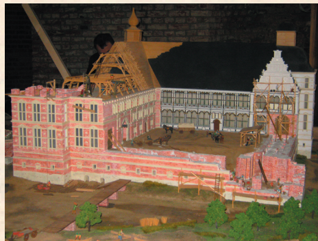
Modell der Schlossbau-stelle im Museum Schloss Horst

Als der Verfall des Schlosses Anfang der 1980er Jahre beängstigende Ausmaße annahm, gründeten Horster Bürger 1985 den Förderverein Schloß Horst e. V., der sich seine Rettung und Erhaltung sowie eine sinnvolle Nutzung zum Ziel setzte. Ein wesentlicher Erfolg dieser Arbeit war der Übergang des Gebäudes in städtische Trägerschaft 1988. Die bald darauf einsetzenden Umbaumaßnahmen wurden ständig gefördert und begleitet. Zunächst von ehrenamtlichen Enthusiasten geprägt, beschäftigte der Förderverein sehr bald auch kompetente Fachwissenschaftler und widmete sich archäologischen, historischen und kunsthistorischen Forschungen, in Zusammenarbeit mit der Stadt und dem Landschaftsverband Westfalen-Lippe.