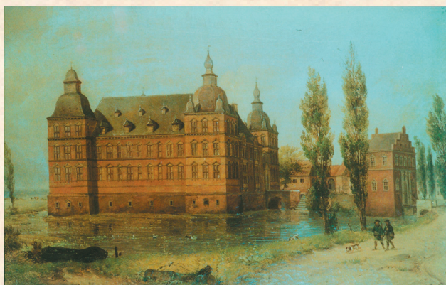
Als Adolf Hönighaus 1842 dieses Gemälde malte, standen zwei der abgebildeten Türme und andere Teile des Baus bereits nicht mehr.

Erst der Erwerb des Schlosses durch die Stadt Gelsen-